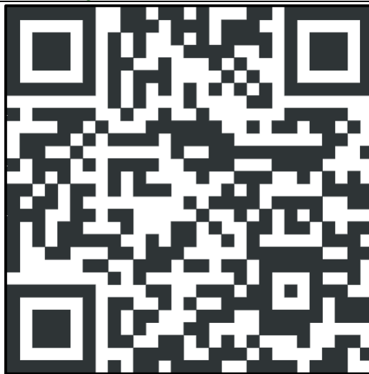
Website del CdLM

Le informazioni relative ad ogni insegnamento sono consultabili anche ai seguenti link: