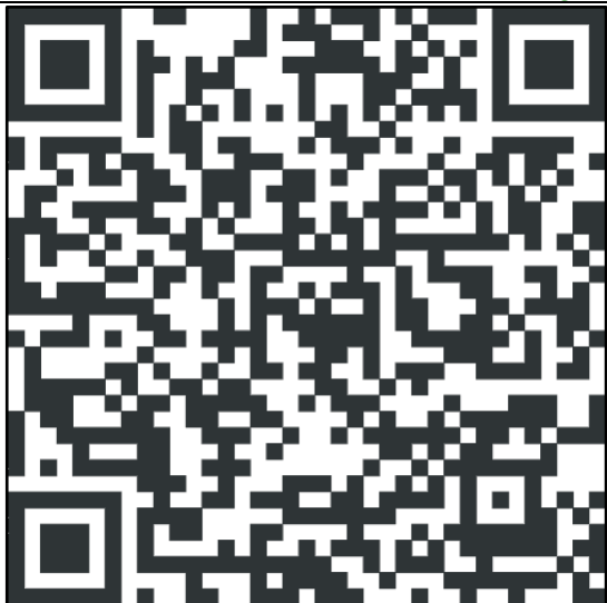
Website del CdLM sul sito della MacroArea