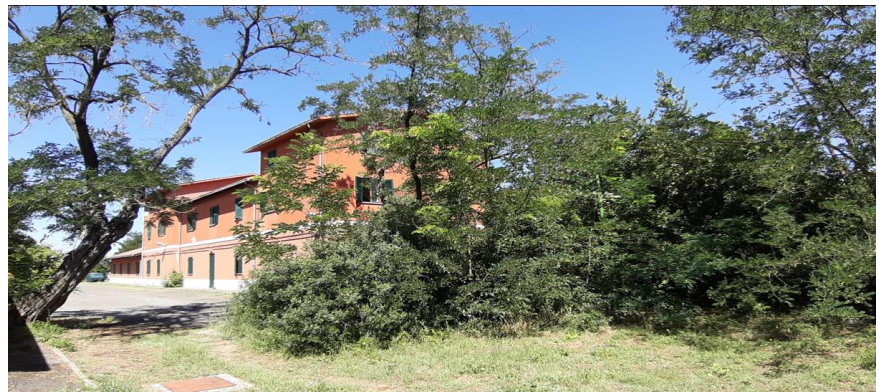
Il L.E.S.A. (Laboratorio di Ecologia Sperimentale e Acquacoltura) è una struttura multifunzionale, dotata di laboratori che permettono di sviluppare ricerche diversificate in vari ambiti tematici

laboratori dipartimentali di didattica e ricerca sperimentale: l' Orto Botanico , il Laboratorio di Ecologia Sperimentale e Acquacoltura (LESA) e il Centro di "Antropologia molecolare per lo studio del DNA antico" . Inoltre lo studente potrà svolgere il proprio tirocinio anche presso laboratori di ricerca universitari e/o altri laboratori di strutture pubbliche o private, e anche all'estero, previa approvazione del progetto formativo.