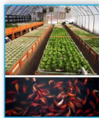
Acquaponica come modello di economia circolare